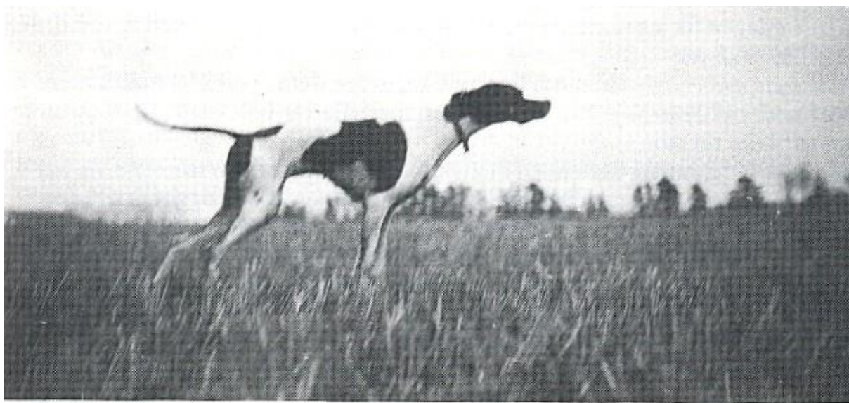
Ch. Torntoft Zita.